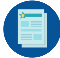
Reparto de Flyers